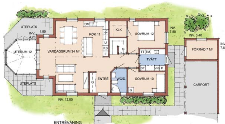
HUS B21 MED UTERUM

ENTRÉVÄNING BOAREA 101 M² BYGGN. AREA 113 M² + CARPORT / FÖRR. 31 M² BRUTTOAREA 113 M² + FÖRRÅD 10 M² OPPENAREA 21 M² (CARP.)