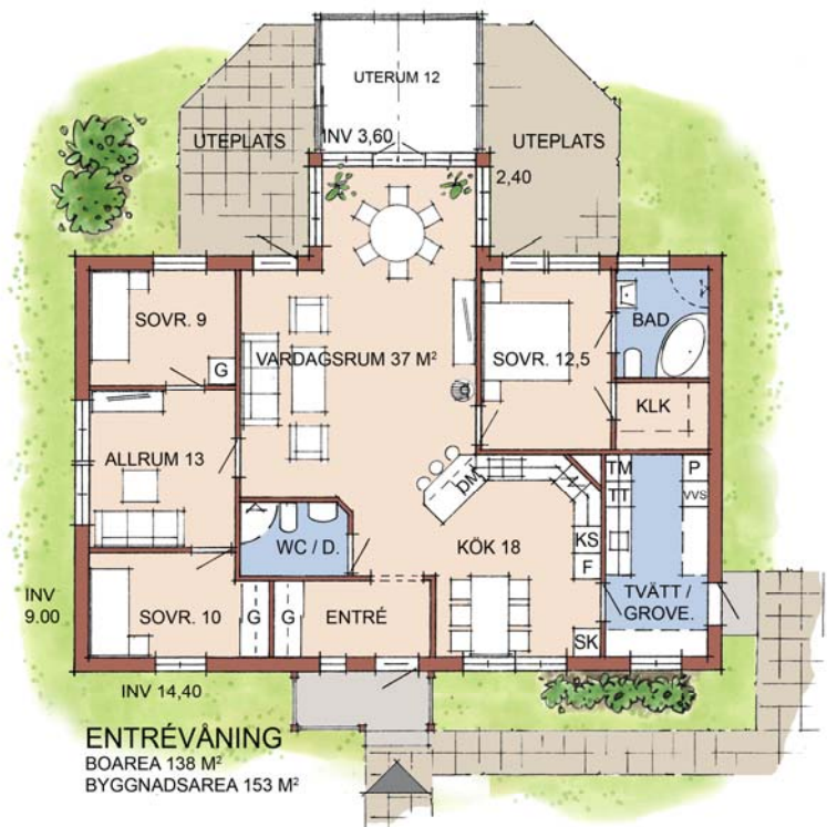
HUS B12 MED UTERUM