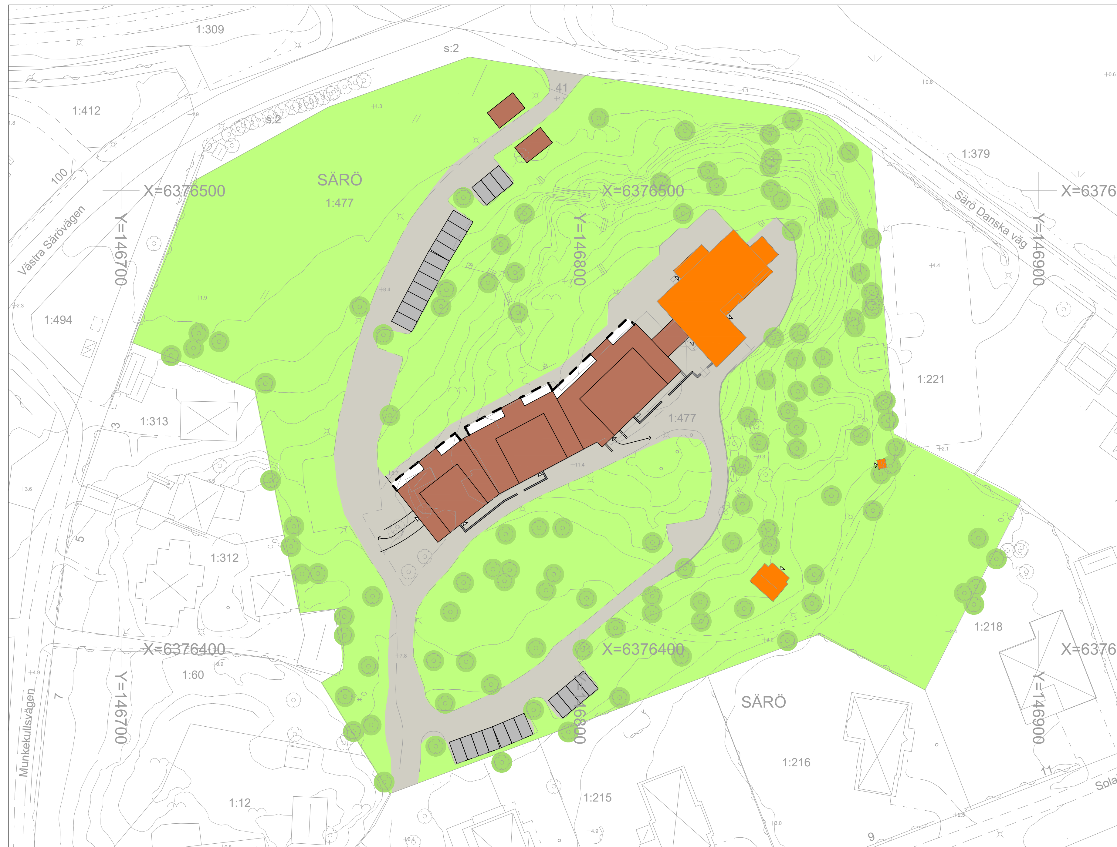
Skala 1:500 i A1, 1:1000 i A3 0 10 20 30 40 50 m Detaljplanen är baserad på koordinatsystemet SWEREF 991200 och höjdsystemet Rh 2000