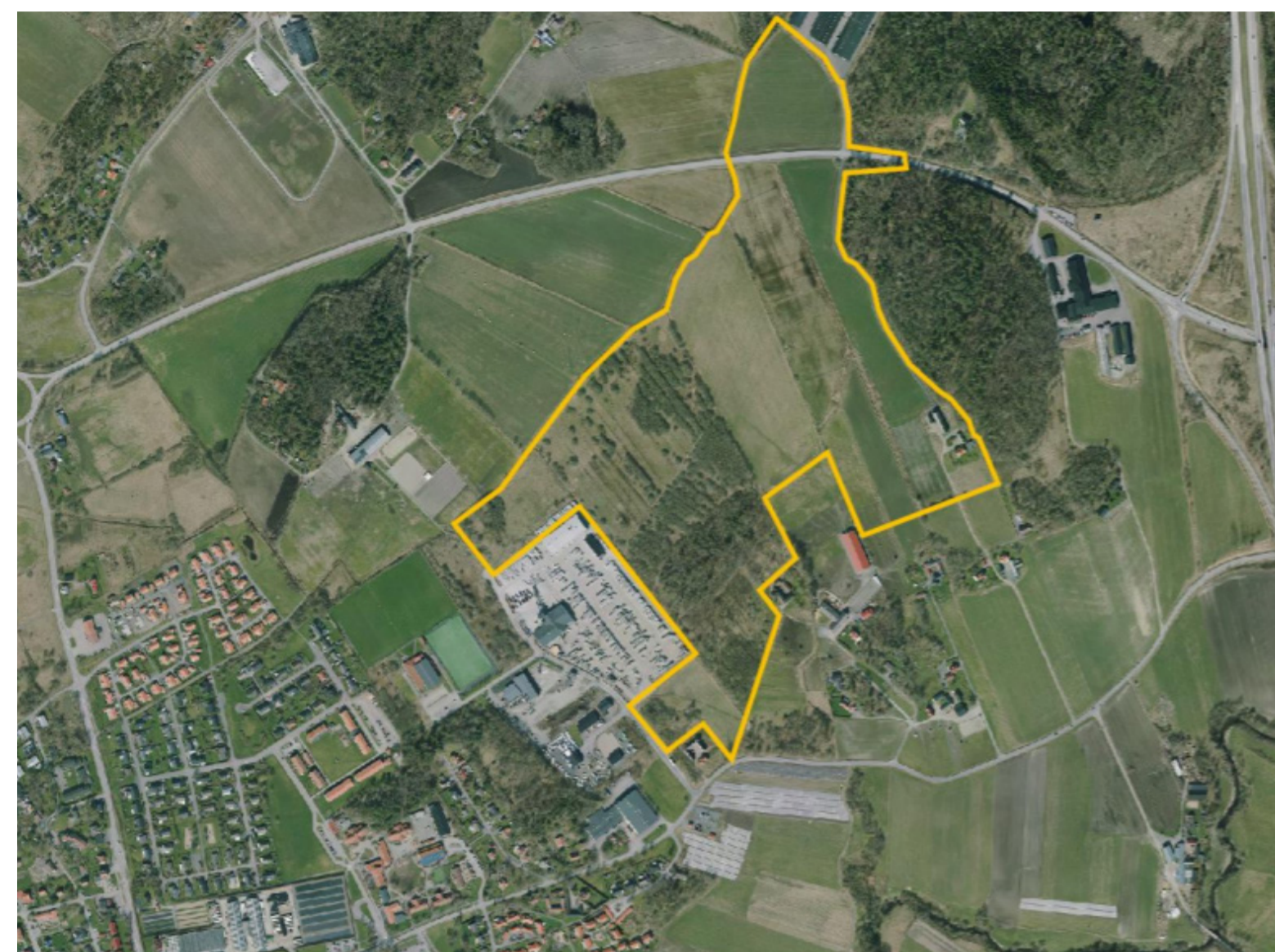
Ovan: Översiktsbild. Planområdets utbredning visas med gul linje. På höger sida syns Frillesåsmotet vid E6, och till vänster i bild syns delar av Frillesås centrum.

Laga kraft Tidigast tre veckor efter det att politiken har antagit detaljplanen vinner den laga kraft. Då är det inte längre möjligt att överklaga den.