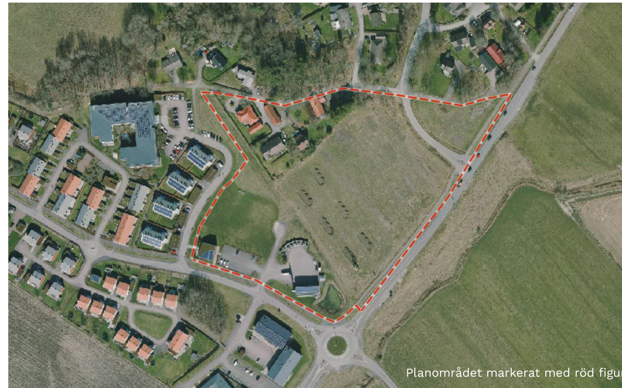
Planområdet markerat med röd figur.

Tidigast tre veckor efter det att politiken har antagit detaljplanen vinner den laga kraft. Då är det inte längre möjligt att överklaga den.