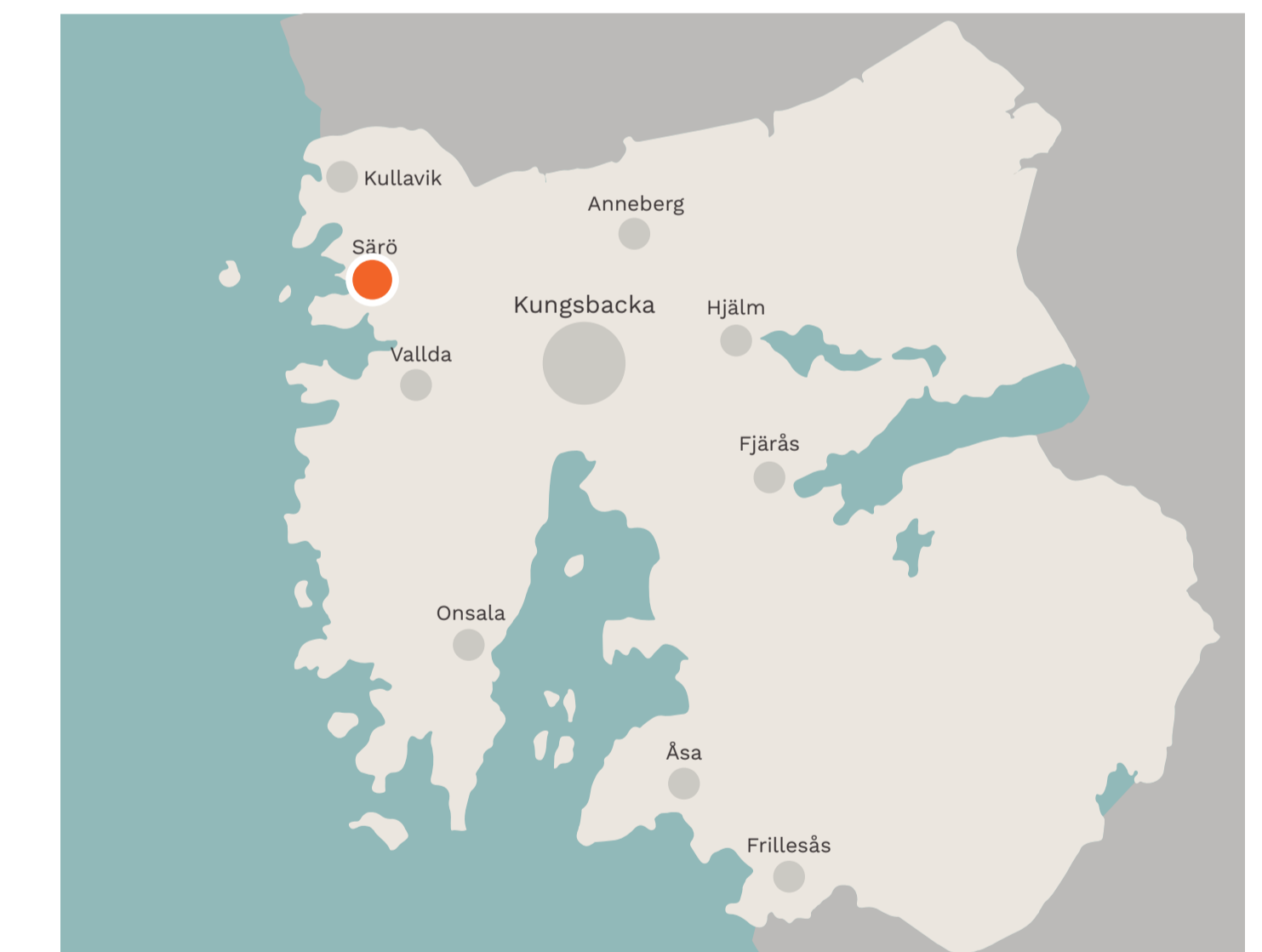
Orienteringskarta. Orange markör visar på ett ungefär var planområdet ligger.